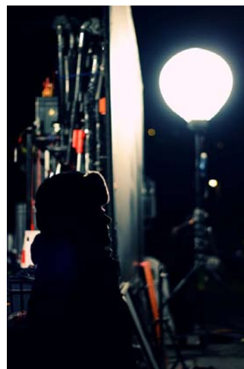
Pauline Goasmat sur le tournage d'Autopsie