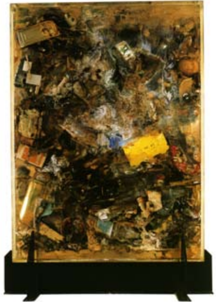
Arman, Poubelle , 1971

Arman radicalise l'utilisation des déchets en les élevant directement au statut d'œuvres d'art. Les débris et rebuts deviennent, dès 1959, son matériau de prédilection. Il est célèbre pour ses Accumulations : assemblages d'objets usagés identiques présentés dans une boîte vitrée. L'objet acquiert ainsi une puissance expressive par la répétition. Il utilise aussi directement les détritrus : il réalise des «portraits» à partir des poubelles personnelles des gens, présentées dans des boîtes de verre.