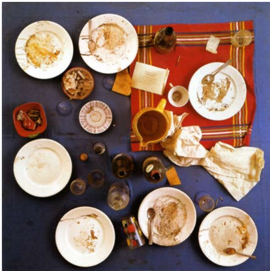
Daniel Spoerri, Tableau-piège, Table bleue, Galerie J, 1963

Daniel Spoerri saisit la réalité telle quelle, il la «piège» et l'accroche au mur en un «tableau-piège». Le passage du plan horizontal de la réalité au plan vertical de l'œuvre d'art donne aux objets une présence insolite. Ainsi, Les puces (1961) est un tableau réalisé à partir d'un étalage découvert sur une brocante. Spoerri organise des «dîners-piégés» : à la fin du repas, il colle le couvert et les restes sur le plateau de la table, qu'il accroche au mur ; c'est ce qu'il nomme ses «tableaux-pièges». Par exemple, Table Bleue, Galerie J a été réalisé à la suite d'un dîner organisé par l'artiste dans une galerie parisienne.