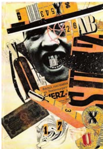
Raoul Hausmann, ABCD , 1923-1924

Ils construisent des compositions en collant toutes sortes de fragments de papier, d'illustrations et de textes récupérés dans des magazines, des tickets, des billets de banque, des morceaux de planches anatomiques, comme Raoul Hausmann dans ABCD . Certains collent aussi de petits objets sur la surface de leurs toiles peintes.