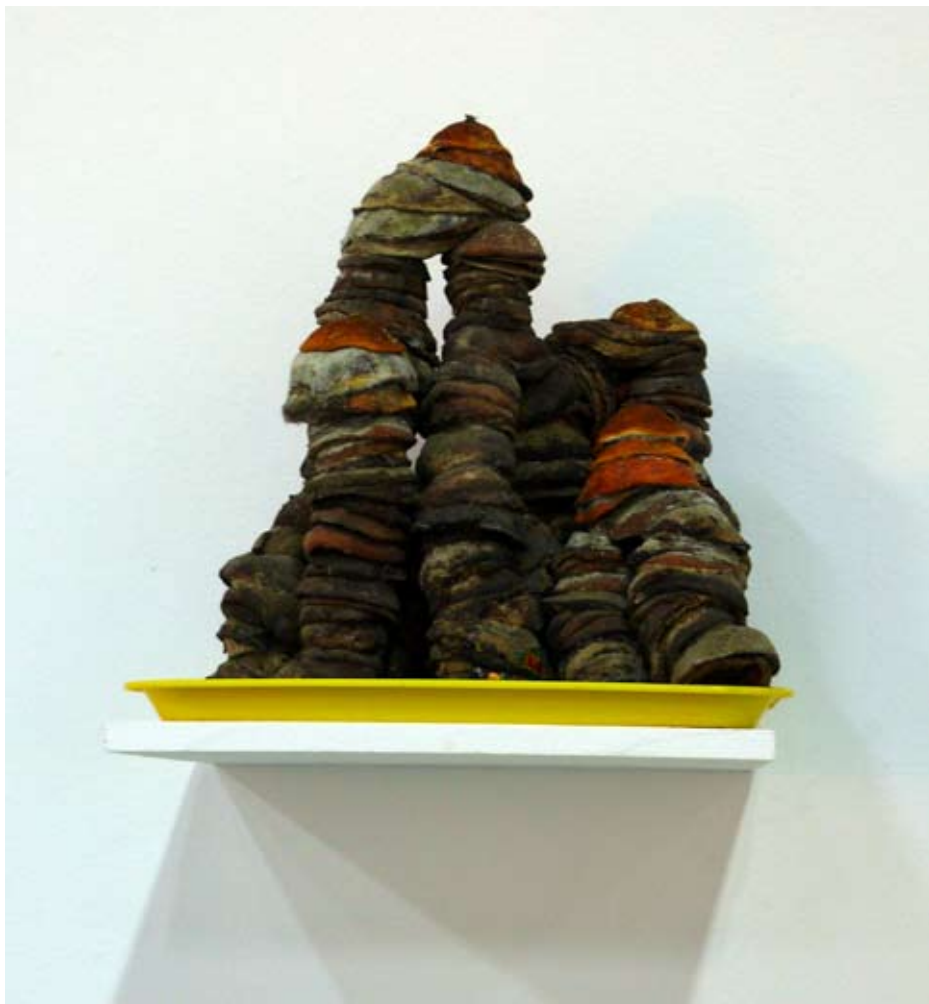
Michel Blazy, Exposition Post Patman , Palais de Tokyo, Paris, 2007

Les différents stades de transformation de ses installations éphémères constituent le développement de son œuvre, mettant en lumière l'ambiguïté de la force vivante : à la fois puissance régénératrice et vecteur de dégradation. Ses installations en matières comestibles forment un étrange bestiaire, un cabinet de curiosités paradoxales.