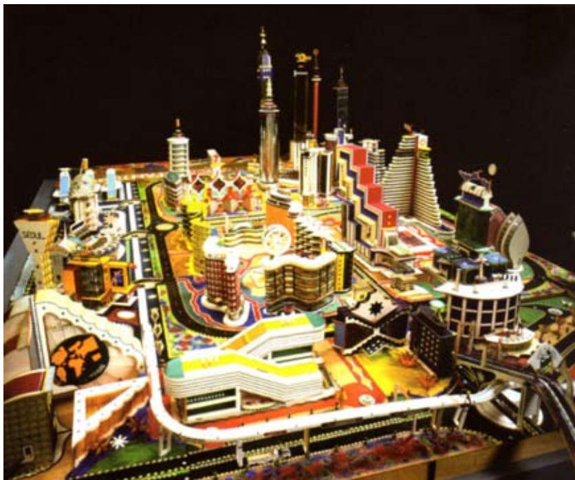
Bodys Isek Kingelez, La Ville Fantôme , 1996