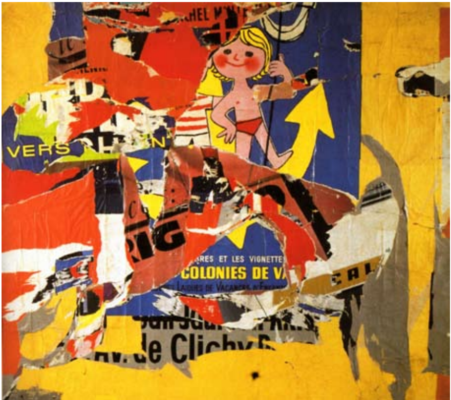
Jacques de la Villeglé, Rue Lauzin , 5 février 1964

François Dufrêne, Jacques de la Villeglé, Raymond Hains et Mimmo Rotella puisent leur inspiration dans des promenades urbaines: ils recueillent des affiches qui ont été lacérées par les passants et sont ainsi devenues illisibles. L'œuvre est donc le fruit de facteurs aléatoires, le résultat des déchirures effectuées par les passants anonymes. Ces œuvres remettent en question la reconnaissance de l'artiste, en accordant une valeur artistique à des gestes insignifiants. Ils tournent ainsi en dérision les artistes expressionnistes abstraits* qui dominaient la scène artistique de l'époque, pour lesquels la valeur artistique reposait uniquement sur le geste pictural du créateur.