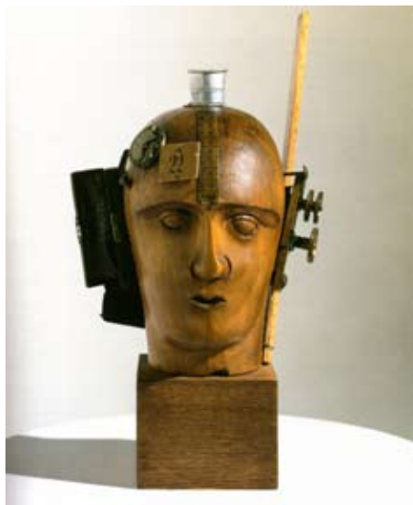
Raoul Hausmann, Tête mécanique , 1919-1920

Ils réalisent aussi des assemblages* : ils fabriquent des sculptures en assemblant différents objets, choisis pour leurs qualités formelles et pour leur signification symbolique. Ainsi, la Tête mécanique de Raoul Hausmann est une marotte de coiffeur sur laquelle l'artiste a fixé divers objets quotidiens (règle, tuyau de pipe, écrin à bijoux...) afin de faire le portrait d'«un homme de tous les jours» et de dévoiler ainsi «l'esprit de notre temps».