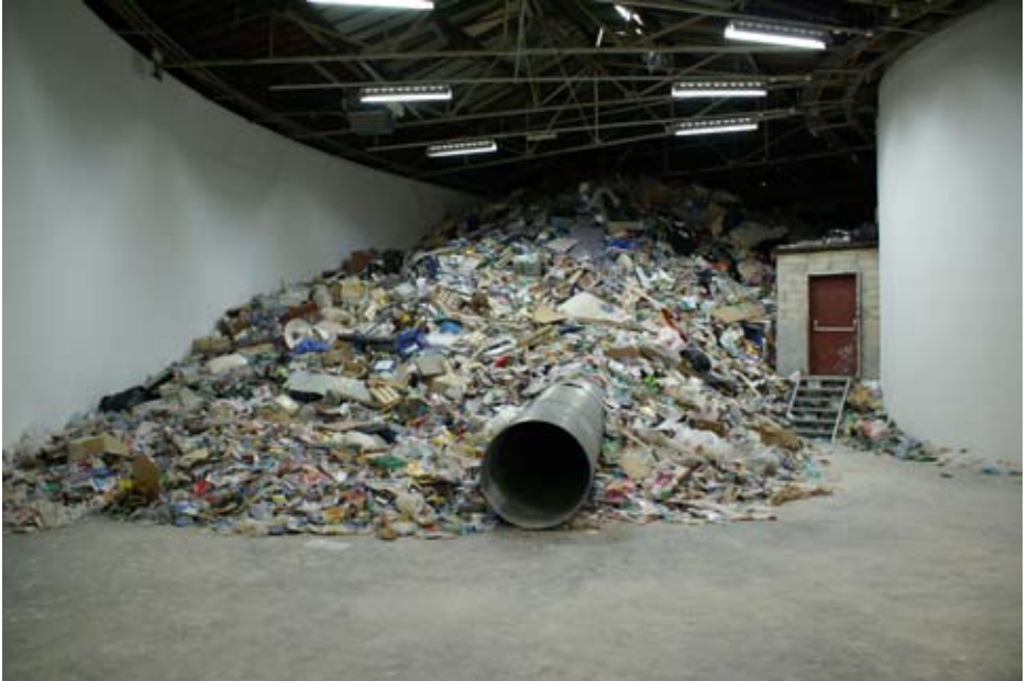
Christoph Büchel, Dump , exposition Superdome au Palais de Tokyo, Paris, 2008