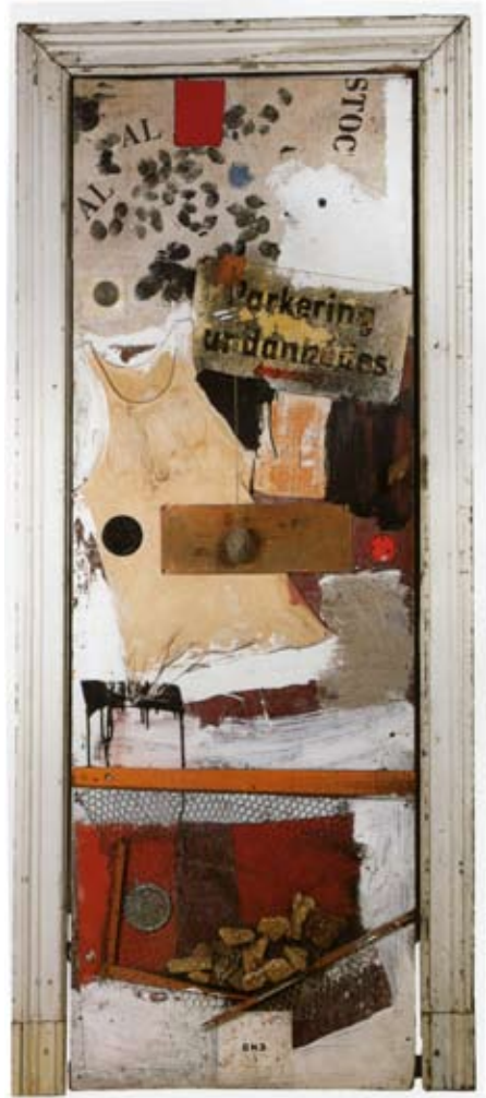
Robert Rauschenberg, Door , 1961