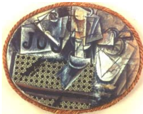
Pablo Picasso, Nature morte à la chaise cannée , 1912

Les précurseurs de cette révolution sont les cubistes Georges Braque et Pablo Picasso. Ceux-ci sont les premiers à intégrer dans leurs tableaux des matériaux inattendus (sciure de bois, sable, papiers collés, ou morceau de toile cirée, comme dans la Nature morte à la chaise cannée , de Picasso, réalisée en 1912). Le geste de ces artistes a initié l'exploration de matériaux toujours plus étonnants dans les œuvres d'art, en particulier l'utilisation de déchets et de matériaux de récupération.