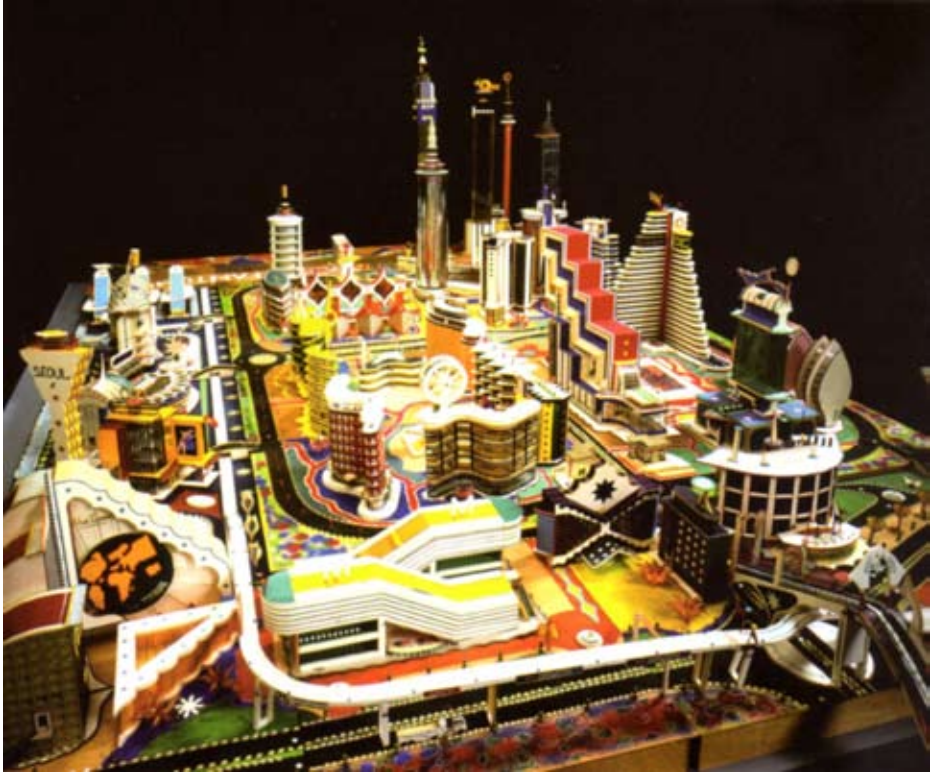
Bodys Isek Kingelez, La Ville fantôme , 1996