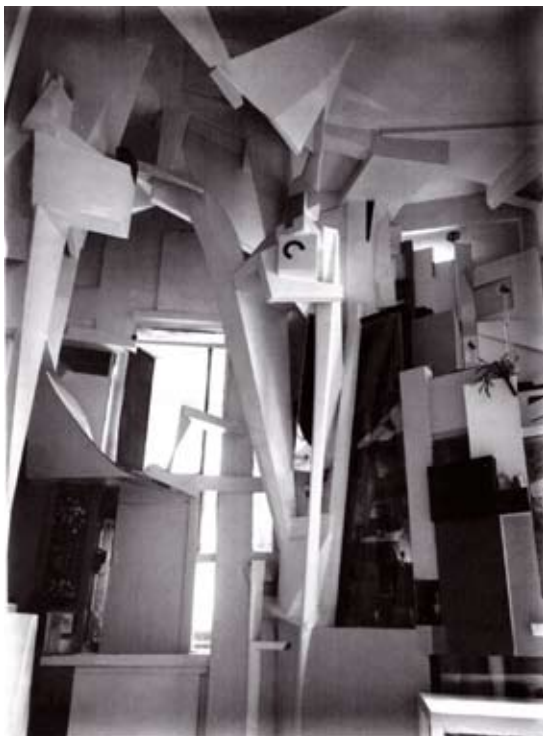
Kurt Schwitters, Vue du Merzbau de Hanovre, 1923-1936

Le Merzbau est une accumulation, une sculpture protéiforme qu'il réalise dans sa maison à Hanovre, une architecture construite à partir de déchets. Schwitters se sert de toutes sortes d'objets incongrus, ramassés au sol dans l'espace urbain. Il les utilise pour leurs propriétés plastiques, leurs formes, leurs couleurs, leurs volumes... Afin de donner à sa construction toute la dimension souhaitée, il découpe même le plafond de sa maison, et cette «cathédrale» finit par traverser trois étages de la maison. C'est une œuvre insolente qui accorde à l'artiste le droit de créer où il le souhaite et avec des matériaux inhabituels. Le Merzbau sera finalement détruit par les bombardements alliés de la 2ème guerre mondiale. Il a été reconstitué lors de la rétrospective* consacrée à Kurt Schwitters par le Musée national d'art moderne de Paris, en 1994.