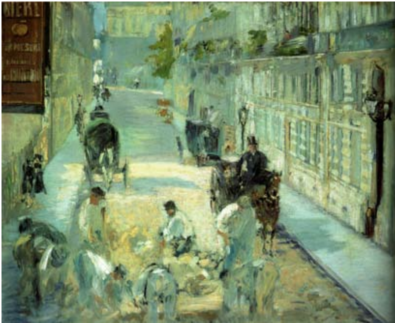
Edouard Manet, La Rue Mosnier aux paveurs , 1878

Manet, chef de file de l'avant-garde sous le Second Empire, est un artiste qui a ouvert la voie à la peinture moderne. Manet s'intéresse à la rue dans la mesure où elle est le lieu d'une vie urbaine. Il cherche à traduire l'atmosphère d'une rue en prenant la position neutre du badaud-observateur. Il n'y a jamais de sentimentalisme chez lui ou de pittoresque, c'est d'ailleurs ce qui explique l'incompréhension de beaucoup de ses contemporains qui, eux, attendent qu'on leur raconte des histoires. Manet se contente de cadrer quasi-frontalement la scène et de supprimer le ciel. Il utilise ici une technique impressionniste qui lui permet de transcrire l'atmosphère lumineuse de la rue et l'activité des paveurs. Comme les impressionnistes, Manet est influencé par les progrès de la photographie. Ici, sa composition s'éloigne d'une composition classique, pour tendre vers un cadrage photographique.