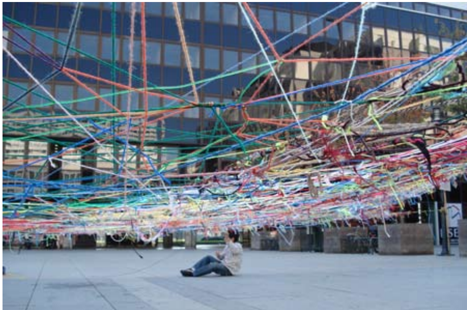
João Modé, Projeto Rede , Rennes 2005

A Rennes en octobre 2007, Joao Modé propose aux habitants et usagers du quartier centre ville - Colombier de tisser une structure souple (cordage, ficelle, laine, tissu, fil, coton...), simple et spectaculaire, sur la dalle du Colombier.