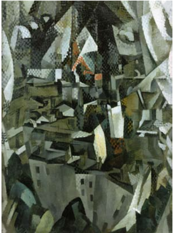
Robert Delaunay, Paysage Paris, La Ville n°2 , 1911

Robert Delaunay est enthousiasmé par la vie moderne transformée par les nouvelles technologies. Dans une série de toiles consacrées à la représentation de Paris, il réinvente la cité moderne avec les principes cubistes hérités de Cézanne : « traiter la nature par le cylindre, la sphère et le cône, le tout mis en perspective ». Il utilise une palette très austère: gris rompus de blancs, terres tout juste égayées de quelques touches de vert. C'est la couleur qui, comme chez Cézanne, bâtit l'espace en plans aigus superposés rythmant toute la surface. Par-dessus, un rideau de touches carrées s'insère entre les plans de manière non figurative, excepté à l'endroit où, partiellement orangées, ces touches font apparaître la forme de la tour Eiffel, symbole universel du dynamisme moderne.