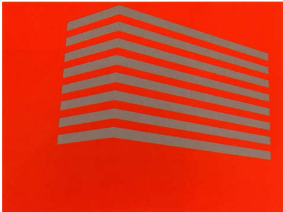
Damien Mazières, Sans titre , 2005

Ses tableaux, présentés sur des supports très minces, voire sous forme de peintures murales, sont des images schématiques qui agissent comme une signalétique. Les œuvres, aux couleurs intenses, figurent des formes minimales de bâtiments. Les architectures épurées sont représentées sous un angle vertigineux. Le recadrage des vues d'immeubles, les couleurs irréelles, les vides et les pleins qui dessinent les perspectives, nous font osciller entre hallucination et réalité.