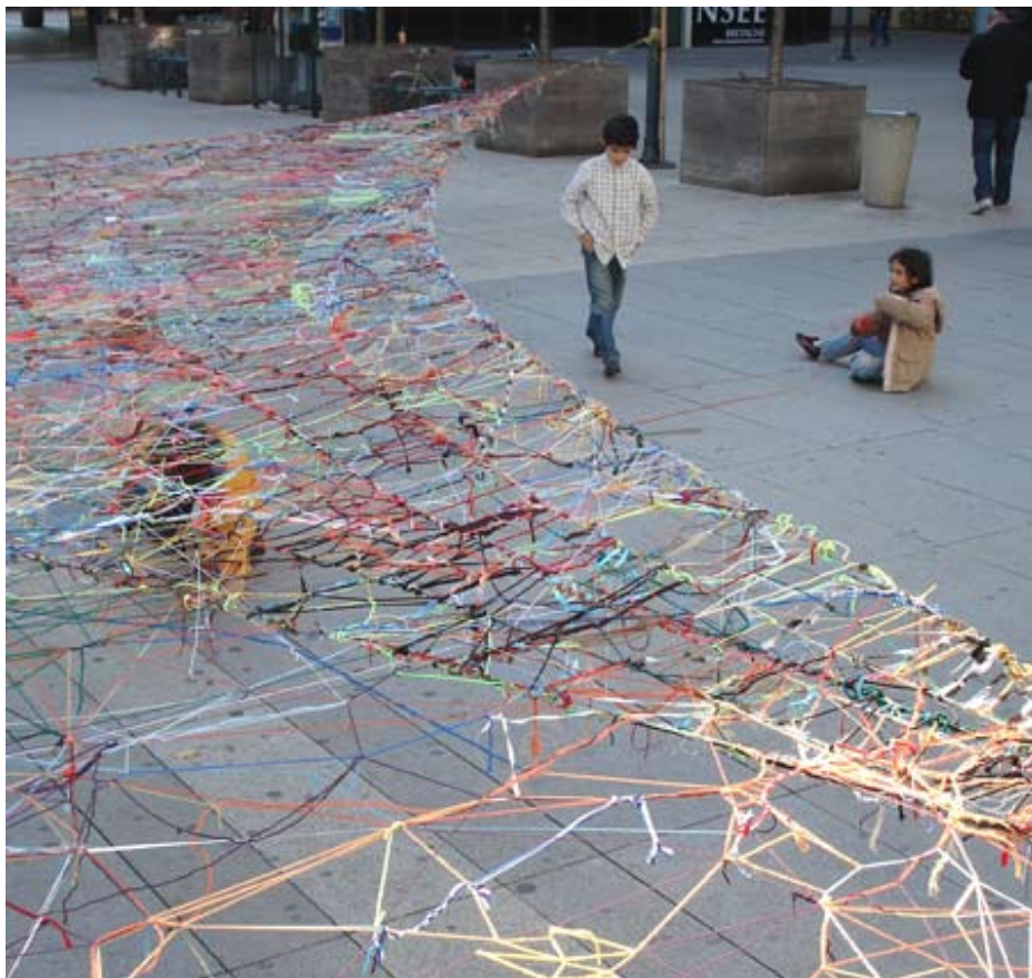
João Modé, Projeto Rede , Rennes 2005

João Modé est un artiste brésilien né en 1961. Il est à l'origine de plusieurs projets artistiques dans l'espace urbain. Projeto Rede (Projet Réseau) est un projet interactif et itinérant ; il consiste à inviter les passants à participer au tissage d'une structure à base de laine, de bouts de ficelle, dans l'espace public.