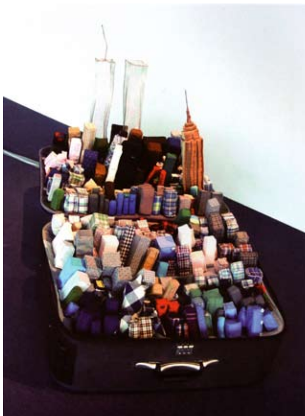
Yin Xiuzhen, Portable City New York , 2003