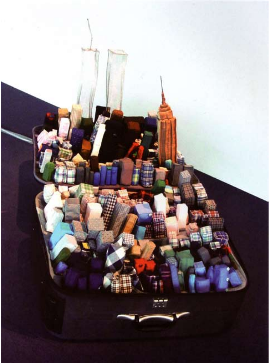
Yin Xiuzhen, Portable City New York , 2003