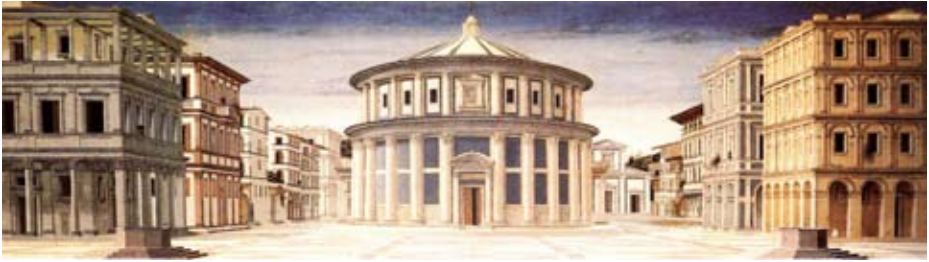
Panneau d'Urbino, Vue de la cité idéale , v.1480

La seconde moitié du 15 e siècle voit s'intensifier en Italie l'étude des textes platoniciens et aristotéliens (contenant des conseils importants pour l'art du « bon gouvernement »). Les nouveaux maîtres des cités, engagés dans un profond effort de réorganisation politique sur leur territoire et influencés par les idéaux humanistes, consacrent une attention nouvelle aux problèmes architecturaux et urbanistiques. De cette conscience naît le mythe renouvelé de la « cité idéale » - une cité ordonnée et fonctionnelle. La cité d'Urbino assume un rôle de guide en accueillant les architectes et les philosophes les plus importants, comme Leon Battista Alberti qui, dans son traité « L'Art d'édifier » (composé vers 1450) pose les jalons essentiels de l'architecture de la Renaissance.