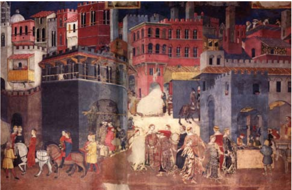
Ambrogio Lorenzetti, Le Bon Gouvernement de la ville (détail), 1338-1340

Mais la représentation de Sienne au sein même de son hôtel de ville a aussi un but politique et moral : la ville est peuplée d'une multitude de personnages, une foule gaie et grouillante qui se livre à toutes les activités susceptibles d'assurer le bonheur de ses habitants.