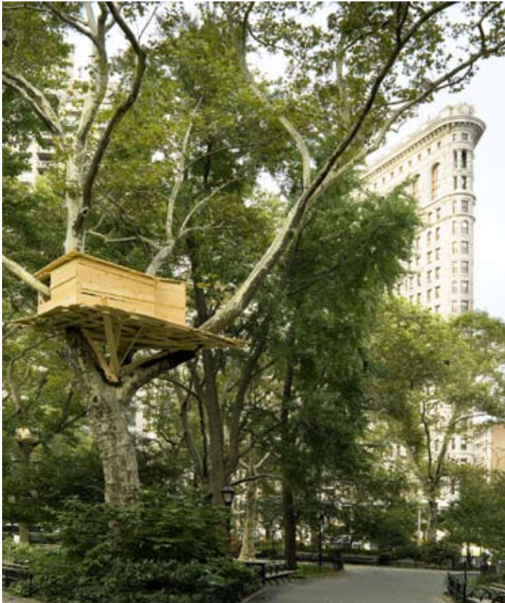
Tadeshi Kawamata, Tree Huts , New York 2008

Huts». Il s'agit de construire de petites cabanes en planches de bois dans différents endroits de la ville. Tenant à la fois de la hutte tribale et archaïque, de l'abri précaire du SDF et du pigeonnier, la position haut perchée des huttes invite mentalement à prendre de la hauteur. Elle plaçait ses hypothétiques habitants lilliputiens hors de portée des prédateurs. Évoquant les jeux de l'enfance, la cabane file en effet la métaphore d'un inconscient refuge, elle permet d'échapper à l'agitation du monde et de retrouver une certaine paix intérieure.