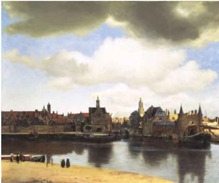
Vermeer, Vue de Delft , 1660

Vermeer délaisse les effets de perspective pour se consacrer essentiellement à l'expression de la lumière. Il concilie l'analyse de la lumière et l'exactitude des détails. Vermeer ne cherche pas à restituer une représentation strictement topographique de la ville. Au contraire, il condense le paysage urbain pour en faire une sorte de frise, simplifiant et étendant à sa guise les contours de la ville et distribuant zones sombres et zones éclairées en plaçant sur l'eau des reflets sélectifs et transformés à dessein. Enfin, il accentue la monumentalité du tableau en opposant l'horizontalité de la ville à l'immensité du ciel et de ses grands nuages. C'est la cohérence picturale de l'œuvre elle-même qui dicte à la main du créateur sa conduite, et non l'intention vaine d'une copie fidèle et laborieuse sur la toile.