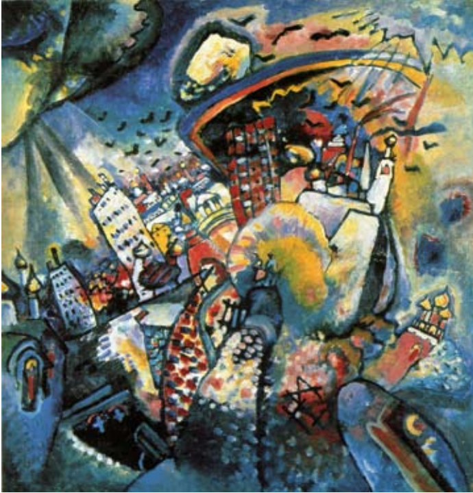
Vassily Kandinsky, Moscou, la Place Rouge , 1916

Kandinsky, qui a peint la première œuvre totalement abstraite en 1910 à Paris, revient à Moscou en 1915. Il se consacre alors à peindre des paysages. Dans le tableau Moscou, la Place rouge , il réussit à concilier les innovations les plus en pointe de l'avant-garde avec certains archaïsmes. Kandinsky cherche à sublimer la Place Rouge, au moyen d'une perspective sphérique, de telle sorte que cette composition constituée de plusieurs monuments historiques ne tient aucun compte de leurs positions topologiques réelles. Il s'appuie sur ses découvertes concernant les formes et les couleurs dans sa peinture abstraite, pour construire un paysage urbain transfiguré. Les surfaces de couleur de ses compositions abstraites deviennent ici les outils pour la représentation d'une nouvelle vision de la ville, témoignage d'une nouvelle conception du monde.