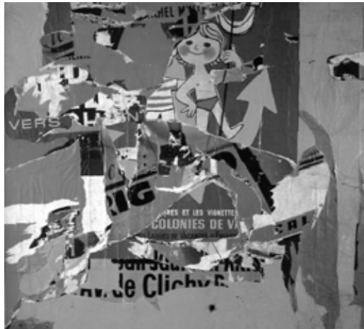
Jacques Villeglé, Rue Lauzin , 5 février 1964