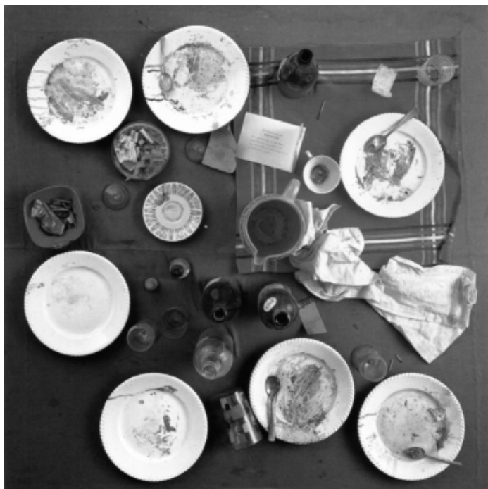
Daniel Spoerri, Tableau-piège, Table bleue, Galerie J, 1963

Daniel Spoerri organise des «dîners-piégés». A la fin du repas, il colle le couvert et les restes sur le plateau de la table, qu'il accroche au mur comme un tableau. C'est ce qu'il nomme ses « tableaux-pièges ». Peux-tu écrire le nom de 5 objets que tu reconnais sur cette oeuvre ?