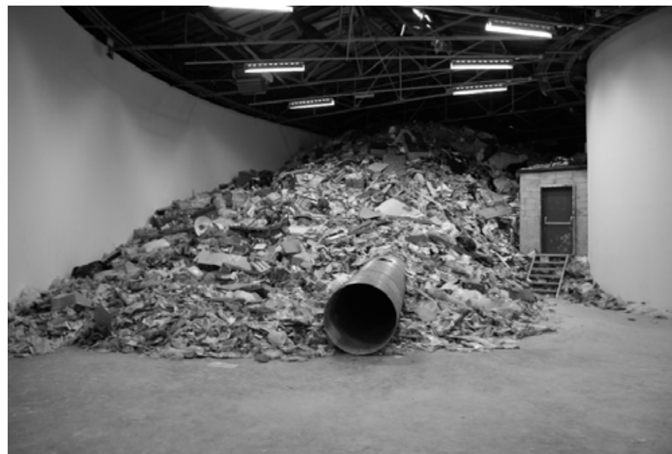
Christoph Büchel, Dump , exposition Superdome au Palais de Tokyo, Paris, 2008

Christoph Büchel est un artiste suisse contemporain . Il réalise des installations à partir des déchets que nous produisons. Durant l'été 2008, il reconstitue une décharge publique dans un centre d'art. Les spectateurs peuvent circuler dans un labyrinthe construit au cœur de l'amas de déchets.