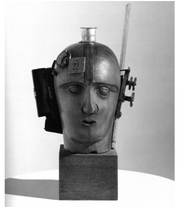
Raoul Hausmann, Tête mécanique , ou L'Esprit de notre temps , 1919-1920