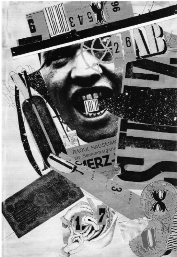
Raoul Hausmann, ABCD , 1923-1924

Raoul Hausmann est un artiste du mouvement DADA (1916-1922). Les artistes de ce mouvement ont créé beaucoup d'œuvres en récupérant des objets usagés. Observe bien les deux œuvres représentées ici : peux-tu reconnaître avec quels objets Raoul Hausmann les a créées ? Indique pour chacune d'elles la technique utilisée :