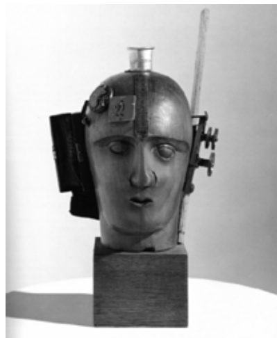
Raoul Hausmann, Tête mécanique , ou L'Esprit de notre temps , 1919-1920