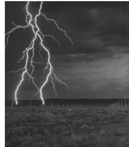
Walter de Maria, The Lightning field , 1977