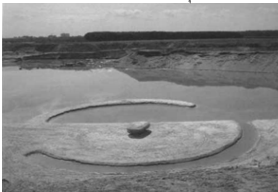
Robert Smithson, Broken circle , 1971

Il utilise le tissu pour créer des œuvres éphémères en « emballant » des paysages, des monuments, des lieux. Il pratique le land art (il intervient sur des lieux naturels, dans le paysage et le modifie de manière provisoire ou durable). Son but, « Révéler en cachant ».