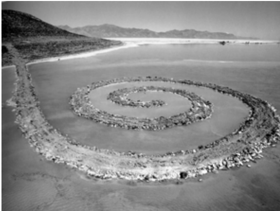
Robert Smithson, Spiral jetty , 1970