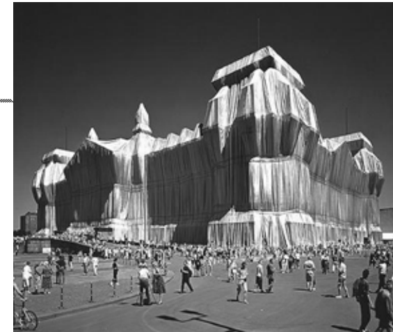
Christo et Jeanne-Claude, Wrapped Reichstag , 1971-95

Gerry Schum a monté un projet d'exposition télévisuelle en 1969. Huit artistes ont participé à la création d'une oeuvre éphémère qui n'existe que sous la forme du film diffusé à la télévision.