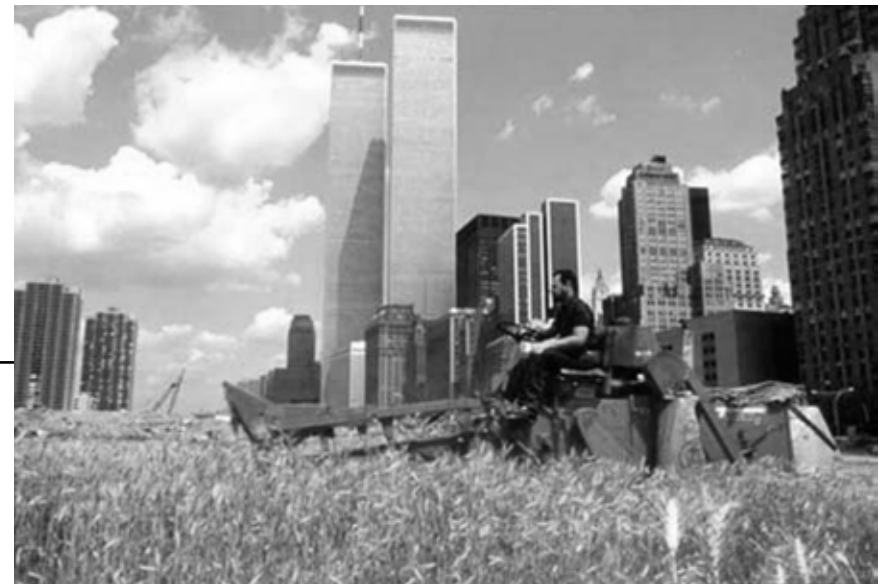
Agnes Denes's, A Confrontation , 1982