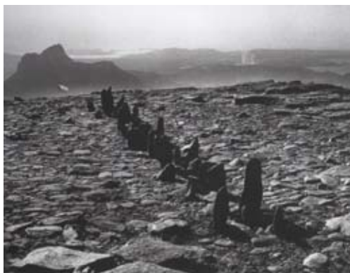
A Line in Scotland, Cul Mor, 1981

Heureusement, il ne faut pas forcément aller au bout du monde pour voir des installations Land Art, on peut en voir dans les parcs de sculptures, qui sont comme des musées en extérieur. Le plus proche et le plus connu en Bretagne est le Domaine de Kerguéhennec, où l'on peut voir des oeuvres in situ, que les artistes ont créés pour le lieu.