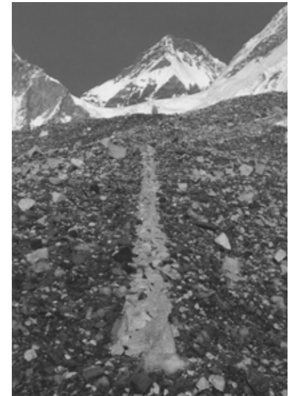
A Line in the Himalayas, 1975

Il fait de la ligne son signe. Sur la photo de son intervention, dans l'Himalaya, la ligne oriente le regard, elle le dirige dans la profondeur de l'image et rend compte du déplacement. L'artiste traverse à pied des lieux reculés, à travers le monde. Il est le seul à faire l'expérience intime du lieu naturel. Ces déplacements donnent lieu à des sculptures, signes placés dans l'espace. Celles-ci sont présentées au public sous forme de photographie. Richard Long accorde beaucoup d'importance à l'instant, et de cet instant il ne reste que des traces. La sculpture est une marque de son passage, l'oeuvre éphémère n'existe plus qu'à travers la photographie.