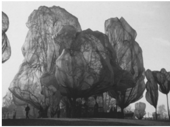
Christo et Jeanne-Claude, Wrapped trees , 1977