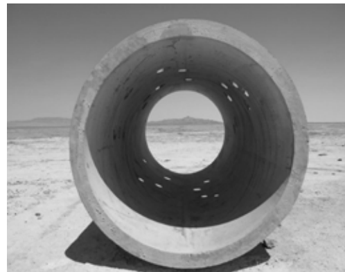
Nancy Holt, Sun Tunnels , 1973-76

Elle choisit le béton car il est composé de sable, et s'intègre dans l'espace désertique, malgré son origine industrielle. L'installation propose une expérience du désert, sur la particularité du lieu. Le dispositif est déterminé par le déplacement du soleil dans le ciel.