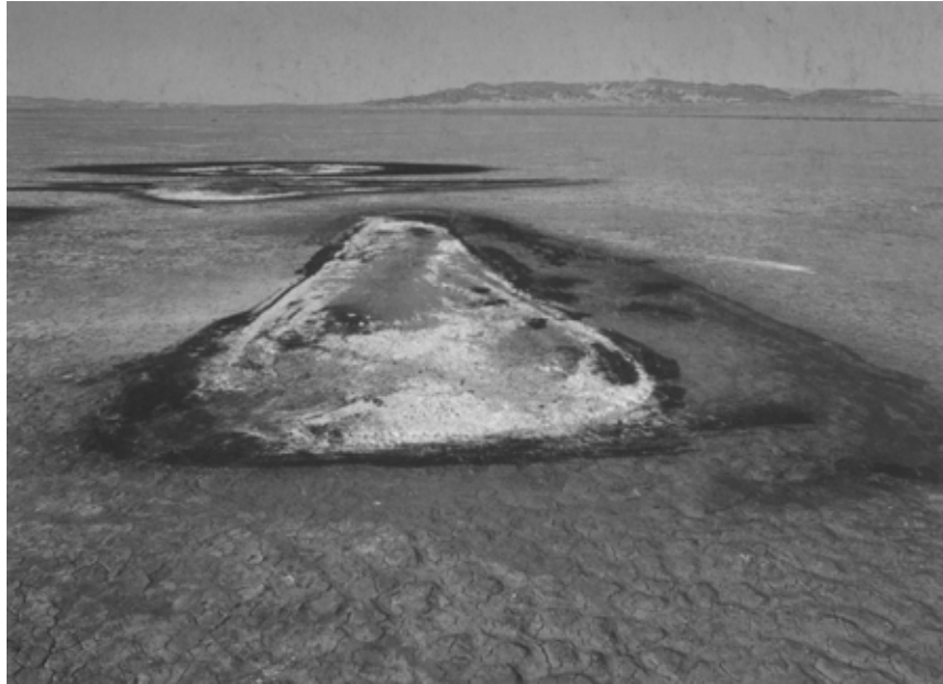
Michael Heizer, Primitive dye painting , 1969

Le travail de Heizer est gigantesque. Il s'oppose à celui de Richard Long, et se rapproche de Robert Smithson. Sa surface de travail est la croûte terrestre, qu'il traite comme une peinture sur la toile, mais à grande échelle. Sa pratique est vaste: elle est conçue pour être vue du ciel. Heizer survole ses interventions, vouées à disparaître. Il photographie le résultat pour garder une trace auprès du public. Regarde la photographie, et décris ce qu'il y a dans ce lieu.