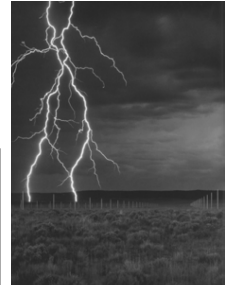
Walter de Maria, The Lightning field , 1977

Pour que les gens les connaissent, ces artistes qui avaient fui la galerie et le musée ont du revenir avec des images de leur installations.