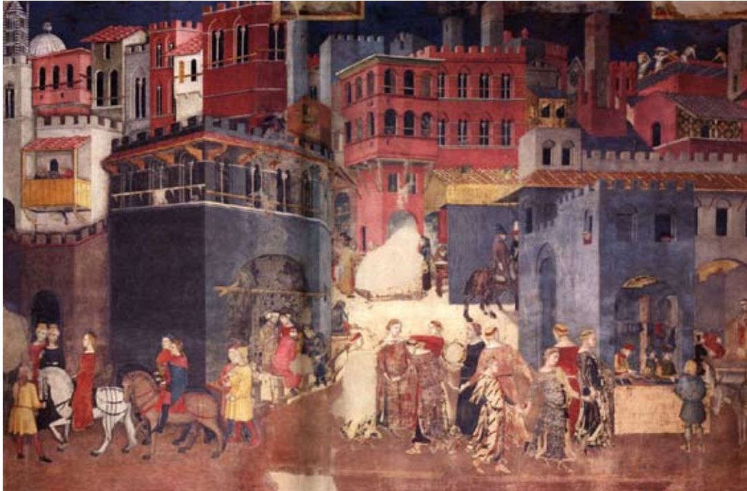
Ambrogio Lorenzetti, Le Bon Gouvernement de la ville (détail), 1338-1340

Voici deux tableaux qui ont été peints à la Renaissance . Ils sont tous les deux la représentation d'une ville, mais ils sont cependant très différents. Peux-tu indiquer les différences entre les deux tableaux ?