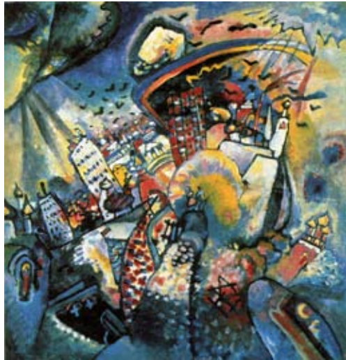
Vassily Kandinsky, Moscou, la Place Rouge , 1916