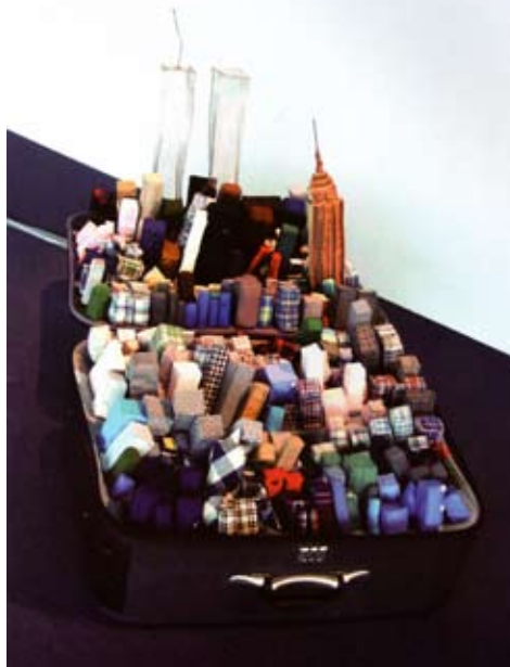
Yin Xiuzhen, Portable City New York , 2003