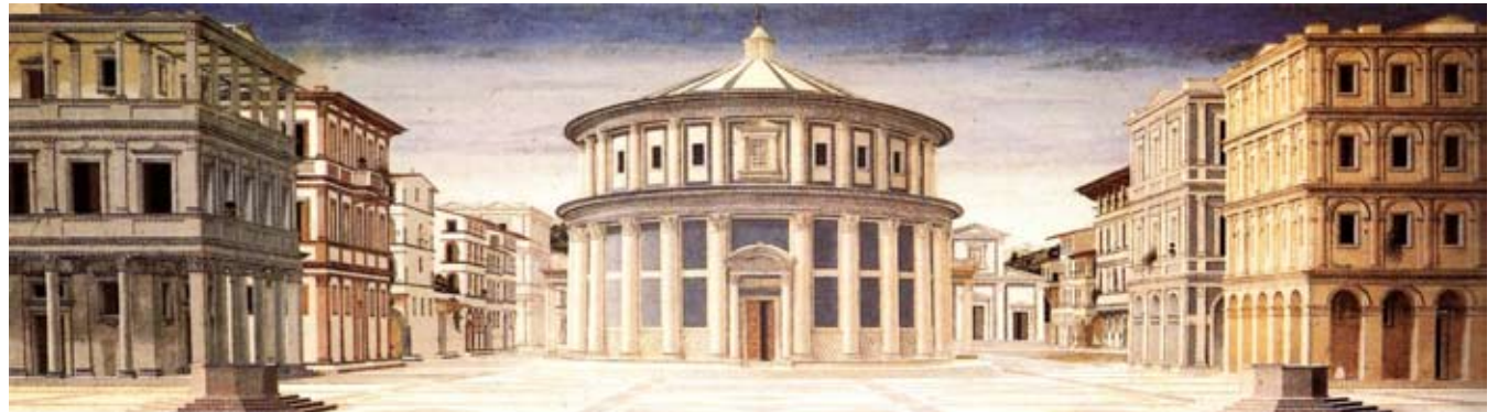
Panneau d'Urbino, Vue de la cité idéale , v.1480