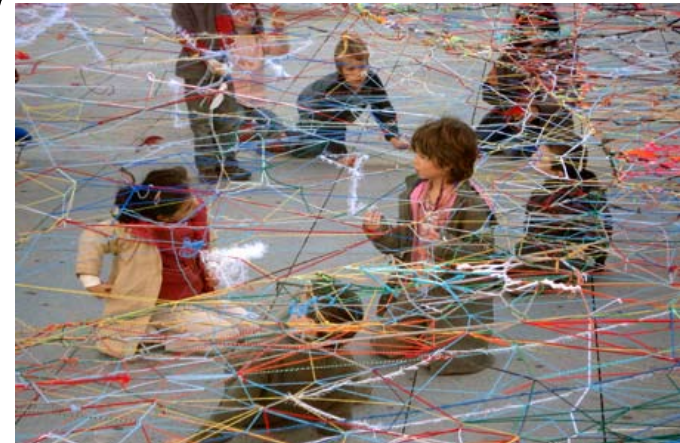
João Mode, Projeto Rede , 2007