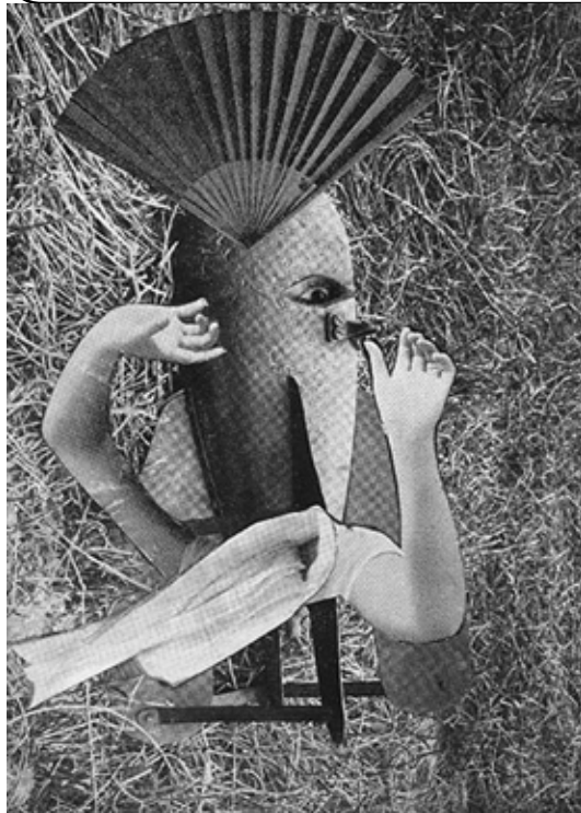
Max Ernst, Le Rossignol chinois , 1920

Ces deux collages montrent des éléments disparates. Chaque artiste déconstruit et recompose les différentes sources d'images. Voici une liste de mots. Avec une flèche, retrouves, quel mot appartient à quel collage.