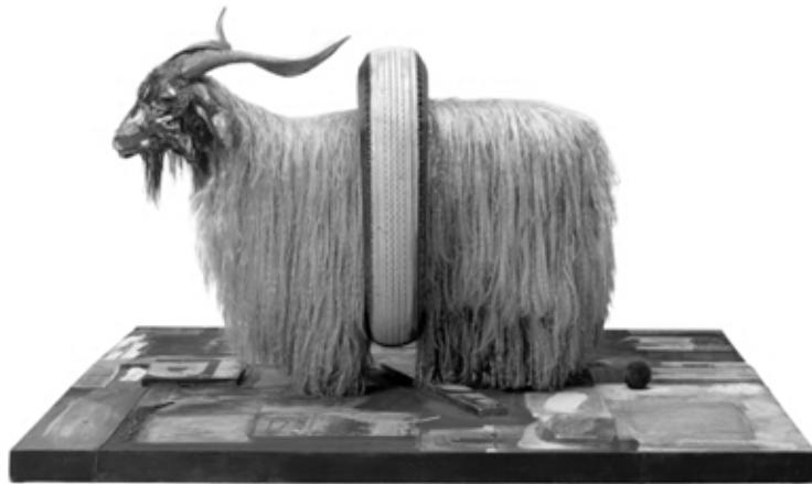
Robert Rauschenberg, Monogram , 1955-1959

Les Combine Painting sont des compositions qui associent la pratique de la peinture, le collage, l'assemblage d'éléments divers prélevés dans notre quotidien. Ni peinture, ni sculpture mais les deux à la fois, les Combines envahissent l'espace du spectateur !