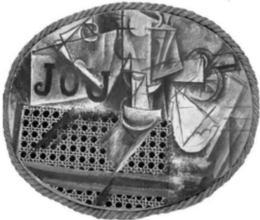
Pablo Picasso, Nature morte à la chaise cannée , 1912