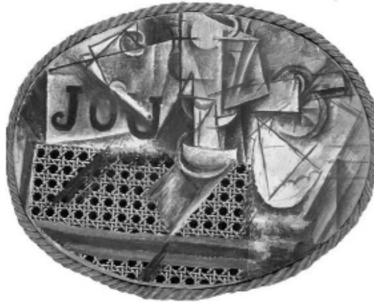
Pablo Picasso, Nature morte à la chaise cannée , 1912

Dès le premier collage de Picasso, la couleur se sépare de la forme. Petit à petit, les compositions peintes ou collées se transforment en assemblages d'informations qui permettent l'objet dans sa totalité.