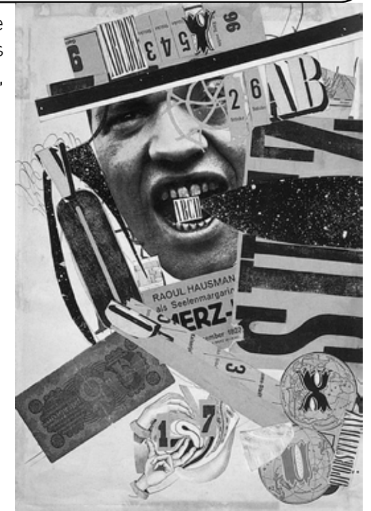
Raoul Hausmann, ABCD , 1923-1924

lettre ~~~~~> tête foulard œil éventail doigt bras billet bombe