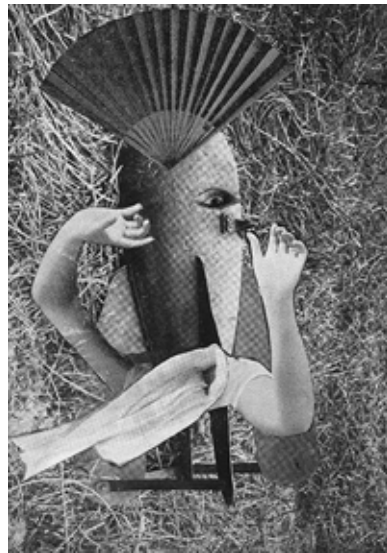
Max Ernst, Le Rossignol chinois , 1920