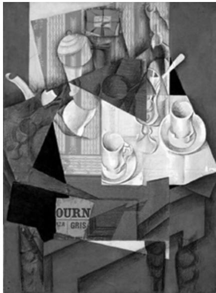
Juan Gris, Petit Déjeuner , 1914

En effet, contourner les papiers collés est un travail plus délicat. Ici Braque ne se préoccupe plus de la peinture et laisse le dessin à même la toile.