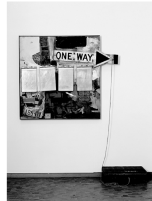
Robert Rauschenberg, Black Market , 1961

Monogram est un des plus célèbres Combines sur lequel Rauschenberg reviendra à plusieurs reprises avant d'arriver à la version définitive. C'est une association d'éléments qui sont différents. Nous avons un tableau posé horizontalement, une chèvre angora au museau peint, avec un pneu d'automobile, et différents collages allant d'une balle de tennis aux papiers imprimés. Cette œuvre n'a rien des assemblages des surréalistes, elle fait appel à des associations non pensées.