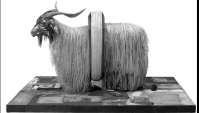
Robert Rauschenberg, Monogram , 1955-1959